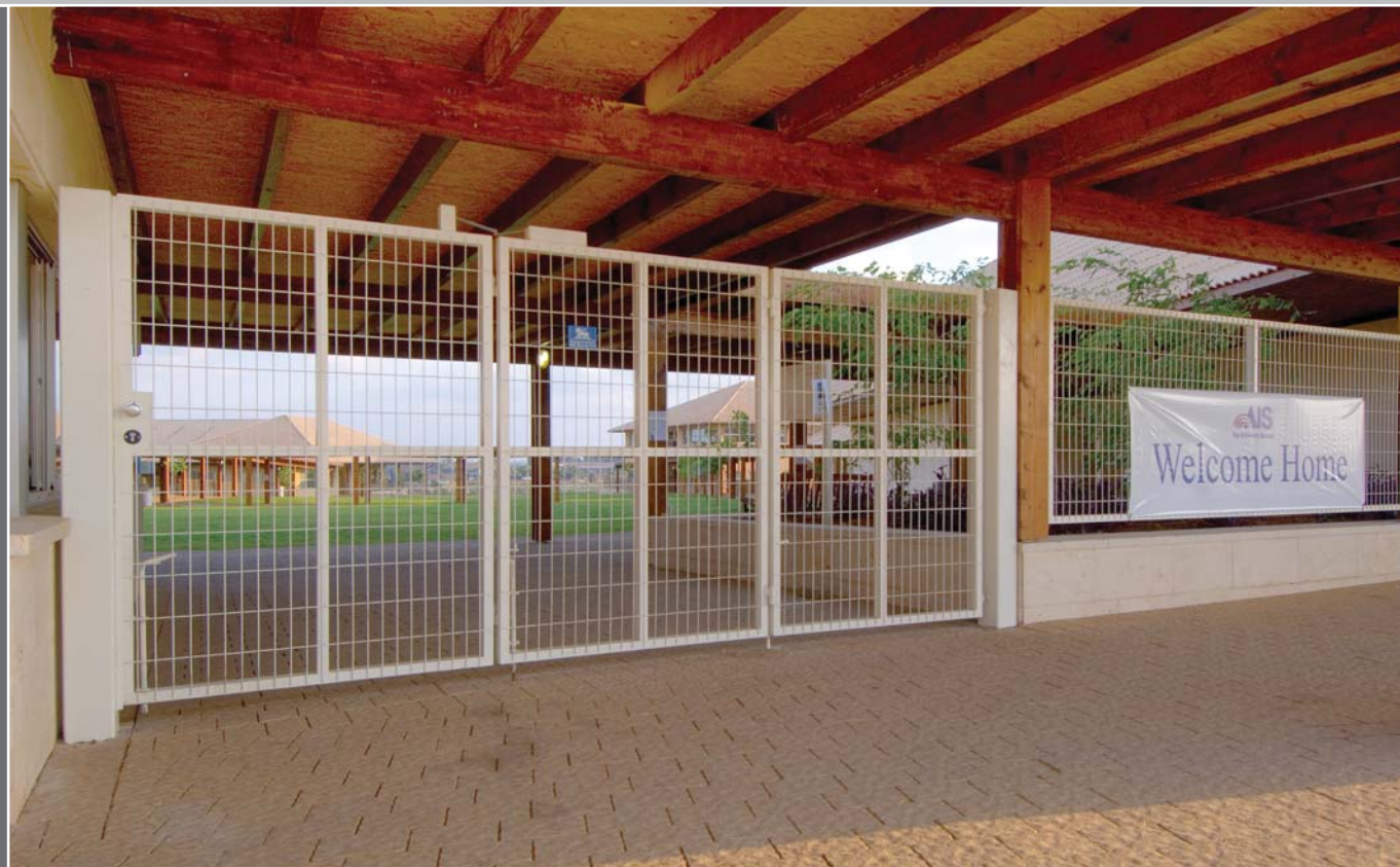
דו-כנפי צבר X